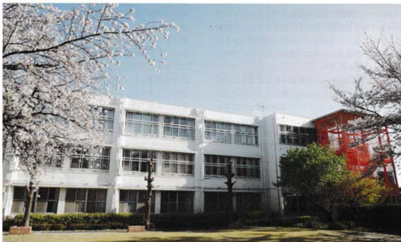
リフォームされたB病棟

患者様やご家族の側に立った医療 患者様の社会復帰を目指す医療 全職員相互の力を発揮できる医療